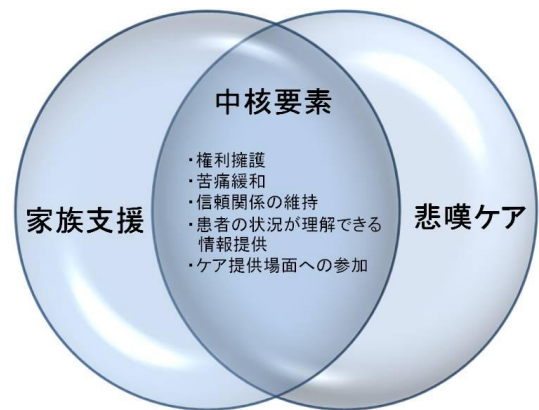
こころのケア中核要素